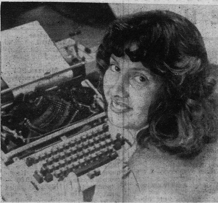
Цех выпуска отчетных табуляграмм — один из основных на машинно-счетной станции СПЗ «Сланцы» (снимок внизу).