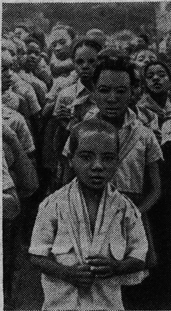
Самые юные граждане Народной Республики Конго недавно отметили десятую годовщину национального пионерского движения. Более двум тысячам школьников в торжественной обстановке были повязаны красные галстуки, подаренные им пионерией Советского Союза.

НА СНИМКЕ: школьники, принятые в пионеры.