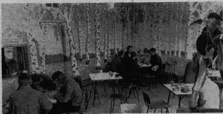
За последние дни значительно изменился облик деревни Загирье совхоза «Сланцевский». Здесь построено четыре двухэтажных жилых дома, столовая. Заканчивается строительство пятого 27-квартирного дома, животноводческого комплекса, рассчитанного на 1.000 голов крупного рогатого скота.

В этом пятилетии в Загирье намечено построить Дом культуры, детский сад, бытовое здание.