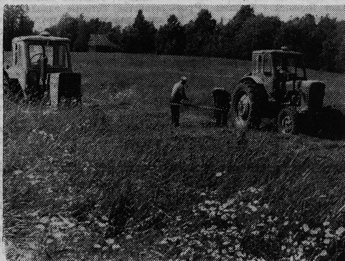
Идет сенокос. На полях совхоза «Аврора».