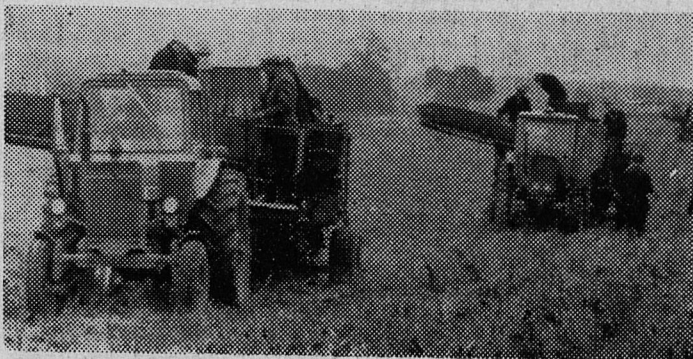
Уборка картофеля, последние гектары.

сена — 13.194 тонны, соломы — 1.896,6 тонны, сенажа — 14.214,4 тонны, силосной массы — 29.591 тонна, готового силоса — 22.631 тонна, корнеплодов — 2.456 тонн.