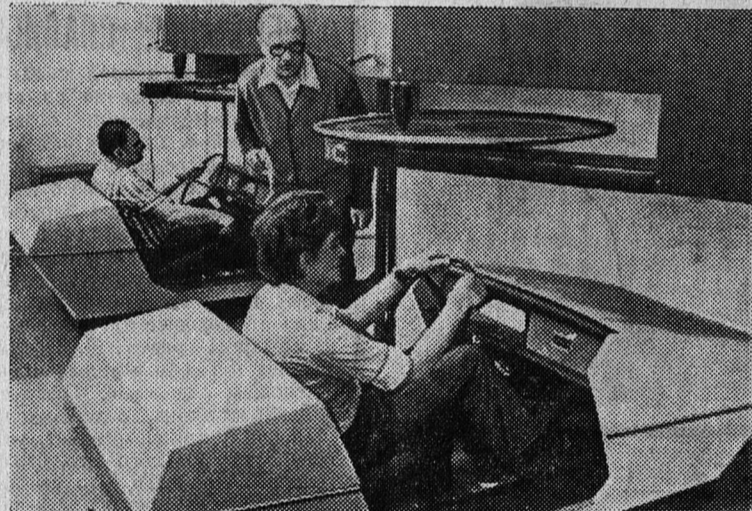
ЭСТОНСКАЯ ССР. В Таллинской автомобильной школе ДОСААФ, которая готовит шоферов, инструкторов практического вождения и автомехаников, недавно оборудован класс автоматизированных тренажеров АТ-70 (на снимке). Он позволяет в помещении отрабатывать навыки вождения машины.