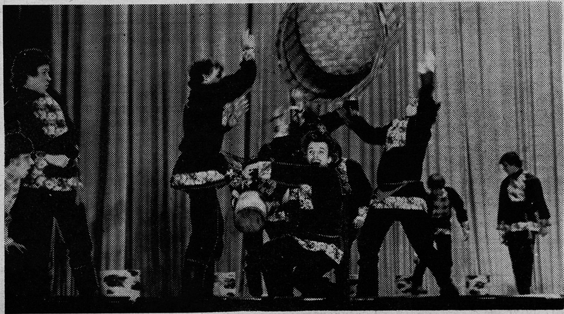
9 декабря в Театре оперы и балета имени С. М. Кирова состоится заключительный зональный концерт третьего тура I-Всероссийского фестиваля самодеятельного творчества трудящихся. Самодеятельные артисты Ленинграда и области, завоевавшие в предварительных турах это право, покажут здесь свое мастерство. Наш

Основной причиной поставки государству некондиционного скота является отсутствие в хозяйствах фирмы «Родина» настоящей заботы об откорме и нагуле животных. Такое положение не должно далее оставаться вне внимания руководителей и специалистов совхозов, ибо из-за поставок государству скота заниженного качества коллективы несут ежегодно большие убытки. В целом по фирме они за три квартала нынешнего года составили 110.346 рублей. Особенно большую «лепту» сюда внесли животноводы совхозов «Сланцевский» — 35.389 рублей и «Родина» — 31.538 рублей. По сравнению с тем же периодом прошлого года убытки по этим совхозам увеличились соответственно на 18.731 рубль и 17.632 рубля. И только совхозы «Аврора» и «Старопольский» уменьшили их на 4.658 и 1.208 рублей соответственно.