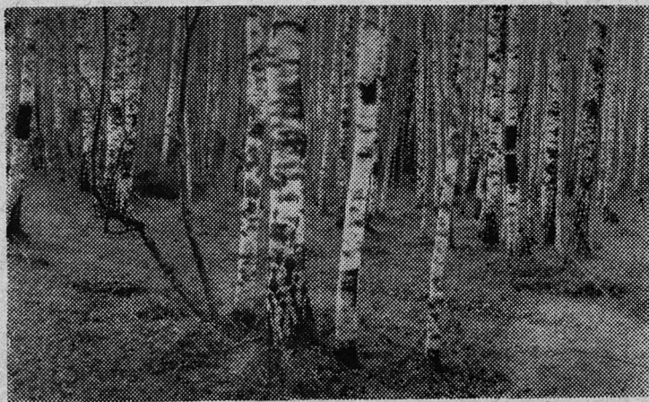
В ОЖИДАНИИ ЛЕТА.