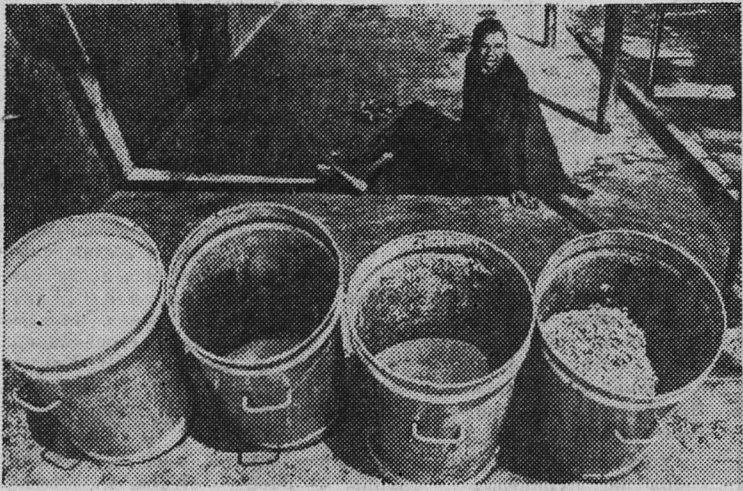
Каторжный труд и бесправие, нищета и полуголодное существование — удел миллионов африканцев в ЮАР. НА СНИМКЕ: в таких металлических баках, используемых обычно для мусора, доставляется пища жителям одной из резерваций в ЮАР.