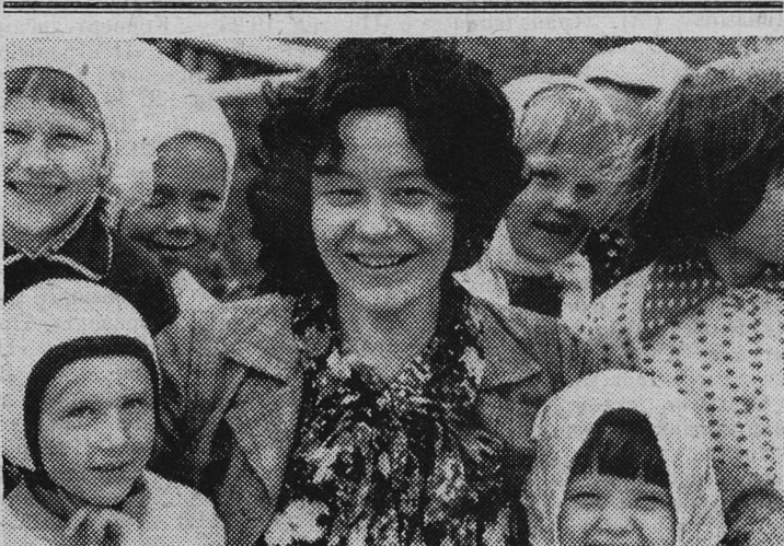
Недавно в Старопольском детском садике-яслях прошел утренник. Посвящен он был проводам ребят старшей группы в школу. На утренник были приглашены родители. Ребята угощали своих пап и мам свежими огурцами, выращенными в садике-огороде, за которым сами ухаживают, где впервые познают любовь к земле, труду. Старшим ребятам на утреннике были подарены портфели.