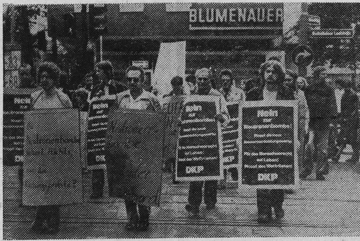
Во многих западноевропейских странах прошли демонстрации протеста против производства в США новой разновидности ядерного оружия — нейтронной бомбы. Прогрессивная общественность решительно осуждает преступные планы Пентагона, связанные с производством нового чудовищного оружия массового уничтожения и оснащением им войск НАТО в Западной Европе.

И после смерти имя Элвиса Пресли приносит доход...