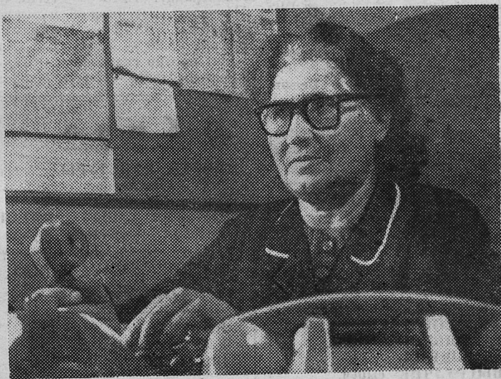
Коллектив завода «Сланцы» готовится к своему юбилею. Особый почет в дни празднования будет отдан ветеранам предприятия, передовикам производства. Среди ветеранов более 150 женщин, некоторые из них уже на пенсии, но продолжают трудиться, не расставаясь с родным коллективом.