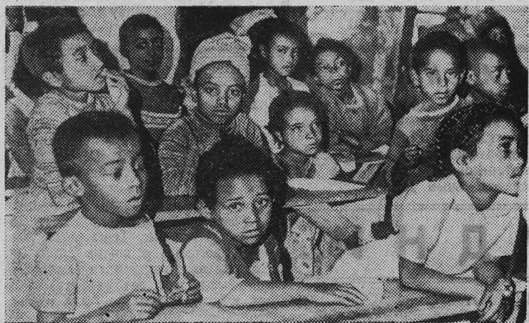
В Эфиопии продолжается осуществление глубоких социально-экономических преобразований.

В стране ликвидируется неграмотность: в городах и деревнях открыты сотни новых школ, десятки тысяч взрослых и детей сели за парты, чтобы научиться читать и писать.