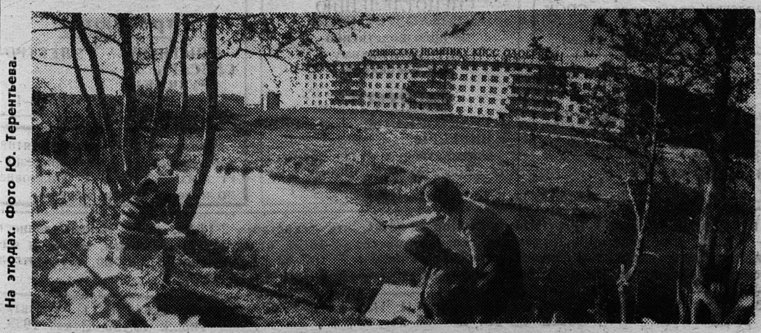
На этиках.