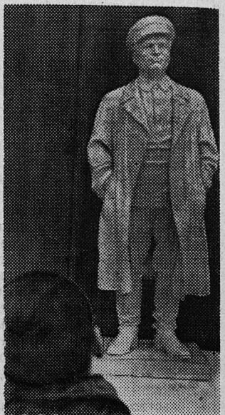
В Сланцевском филиале Ленинградского областного краеведческого музея.

Т. СУСЛОВА, начальник отдела технического контроля регенератного завода.