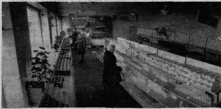
Выросла, похорошела за последние годы деревня Овсище — центральная усадьба совхоза «Осьминский» (снимок внизу). На верхнем снимке: внутренний вид недавно сданного в эксплуатацию продовольственного магазина.