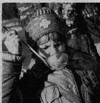
Нет важнее в полевых условиях вкусной каши и горячего чая.