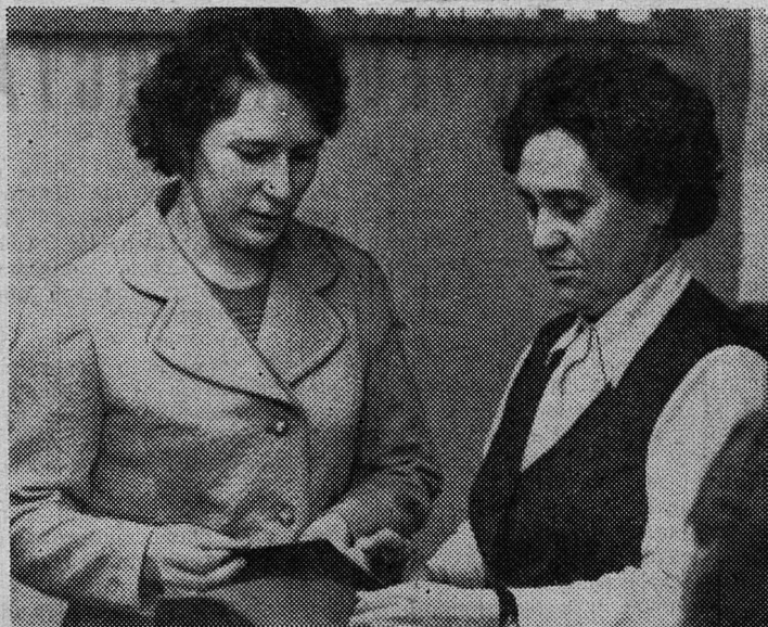
Работа группы народного контроля филиала швейного объединения «Маяк» находится под постоянным контролем партийного бюро. Проверка качества выпускаемой продукции, трудовая дисциплина, санитарное состояние фабрики и экономия сырья и фурнитуры — вот круг забот народных контролеров.