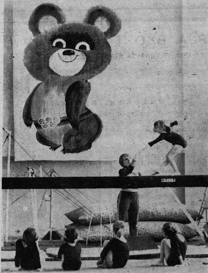
Будущие олимпийцы (занятие гимнастов в Сланцевской ДЮСШ).