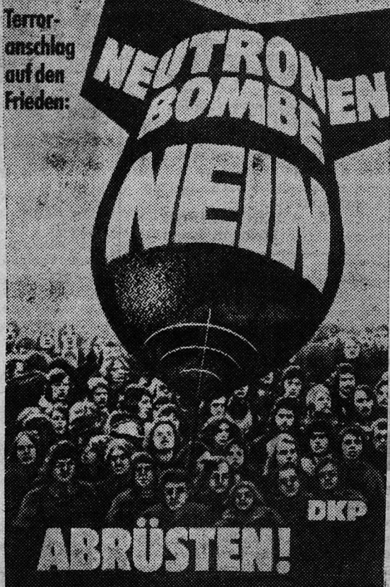
Плакат Германской коммунистической партии (ФРГ) гласит: «Нейтронной бомбе — нет!».

Отвечая на запрос в парламенте, министр иностранных дел С. Сонода заявил, что договор не содержит какого-либо исключения для американских военнослужащих, смотрящих японские телепередачи. (АПН)