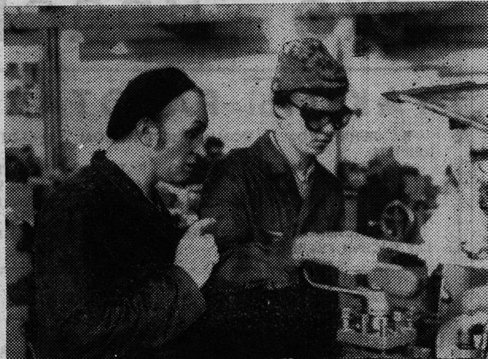
Фотографировали конкурс мастерства Д. Обручев и Ю. Терентьев.