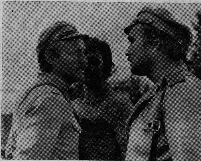
— фильм второй в двух сериях «Да здравствуют нищие!».

18, 19 и 20 января демонстрируется новый цветной широкоэкранный художественный фильм «Легенда о Тиле»