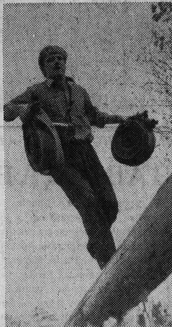
На этапах соревнований.