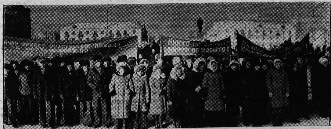
НА СНИМКАХ: (внизу) сланцевчане приветствуют участников похода; (вверху) у знамени полка.