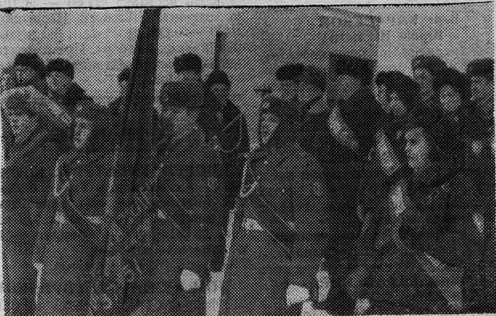
Символичным был митинг, посвященный прибытию в наш город участников похода по местам боевых сражений Ленинградского Гвардейского ордена Кутузова полка имени Ленинского комсомола. Ветераны Великой Отечественной войны передали эстафету молодежи. Сланцевские комсомолы заверили, что будут достойными продолжателями традиций отцов.