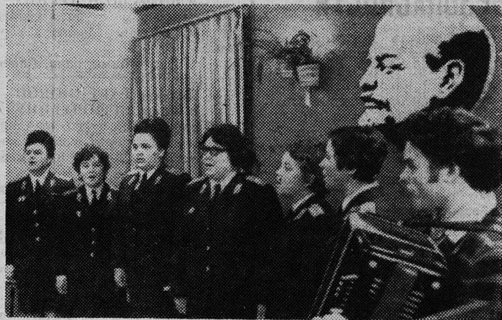
НА СНИМКАХ: (сверху вниз) кубки, завоеванные сланцевцами; выступают участницы художественной самодеятельности Сланцевского ОВД; соревнуются волейболисты.