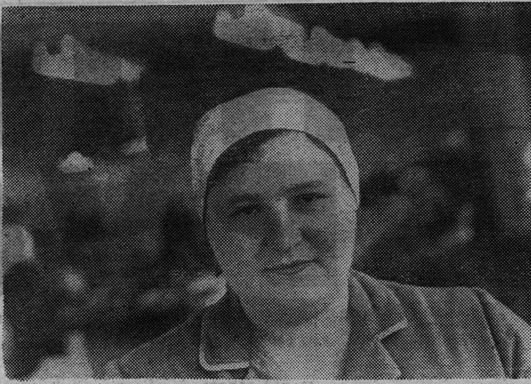
Наставничество: опыт, проблемы, практика