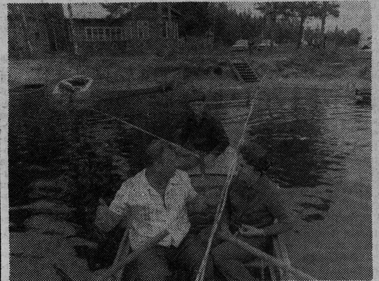
Хороший отдых — рыбалка.