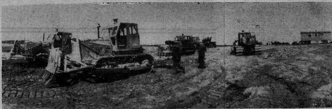
Коллектив Сланцевской передвижной механизированной колонны № 15 за первое полугодие плановые задания по большинству основных показателей выполнил. Совхозам района сдано 259 гектаров земель. Наиболее успешно работал коллектив участка № 2, где был сделан этот снимок.

3) 1,0 килограмма 80-процентного хлорофоса на гектар в период массового лета мух; 4) смесь аминной соли и хлорофоса (1,5+1,0 килограмма на гектар) в фазе кущения. Чистый доход с гектара посевов на 17—19 рублей больше при совместном применении ядохимикатов, чем при раздельном.