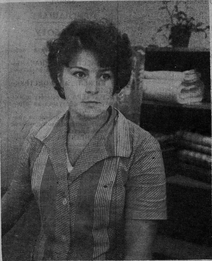
Третий квартал подряд переходящее Красное знамя Сланцевского торгового присуждается коллективу магазина № 45.