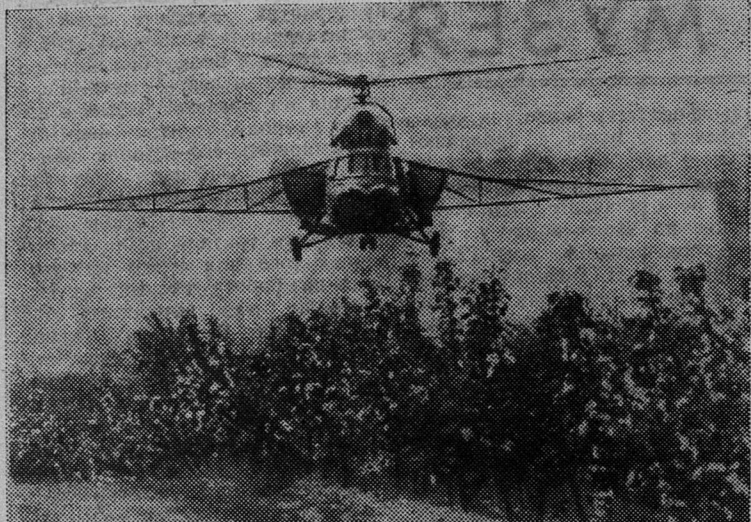
Сотрудничество стран социализма в рамках СЭВ развивается и углубляется в самых разнообразных направлениях: от исследования космического пространства и научных изысканий до интеграции в области сельского хозяйства и возведения народнохозяйственных объектов.