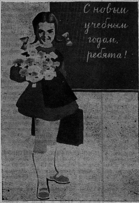
Плакат художника С. Кочанова. Издательство Фотохроника ТАСС