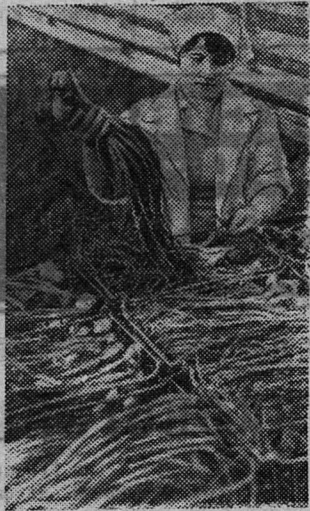
НА СНИМKE: рабочая Г. Урбанавичене готовит к отправке в магазин партию зеленого лука.

Раскинувшиеся на площади в 18 гектаров теплицы, оснащенные автоматическими устройствами для поддержания температурного режима, позволяют круглый год разнообразить стол горожан зеленью.