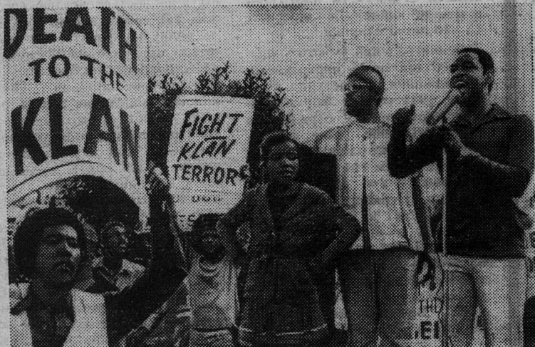
НА СНИМКЕ: демонстрация протеста против очередного шабаша кукулуклановцев в Новом Орлеане.