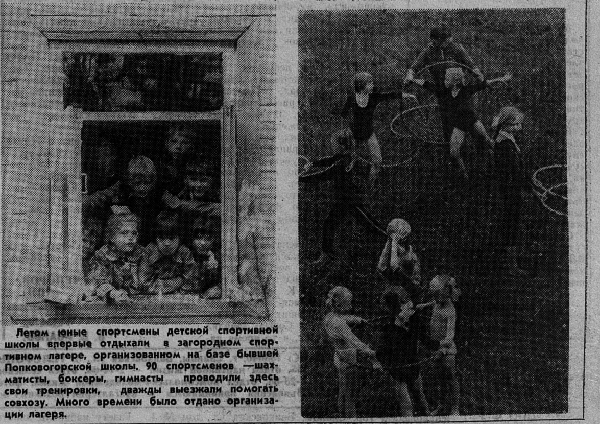
Летом юные спортсмены детской спортивной школы впервые отдыхали в загородном спортивном лагере, организованном на базе бывшей Попковогорской школы. 90 спортсменов — шахматисты, боксеры, гимнасты проводили здесь свои тренировки, дважды выезжали помогать совхозу. Много времени было отдано организации лагеря.

В. СОЛОВЬЕВ, зам. директора Сланцевского торга.