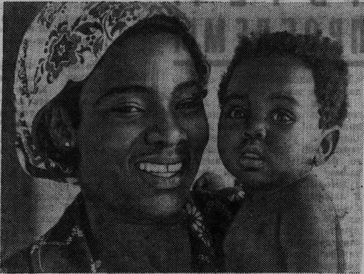
Партия ФРЕЛИМО и правительство Народной Республики Мозамбик проявляют заботу о воспитании подрастающего поколения. В городах и селах страны открываются детские сады, школы, спортивные площадки и парки.