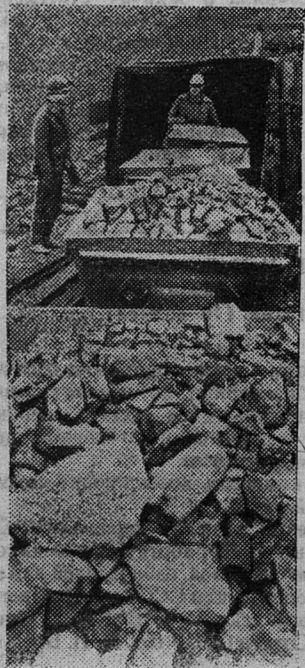
НА СНИМКЕ: промышленная проба удоканской медной руды.

В условиях сурового забайкальского Севера для подсчетов запасов месторождения пробурены тысячи погонных метров скважин, пройдены под землей десятки километров разведочных штолен. В этом году геологоразведчики завершают один из этапов своей работы — подготовку к сдаче в промышленное освоение открытого карьера.