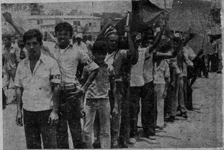
НИКАРАГУА. Праздничная демонстрация. Жители Манагуа выражают радость по поводу трудной доставшейся победы никарагуанского народа над диктатурой Сомосы.