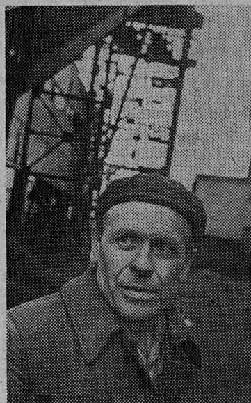
— ется старое оборудование на современное, более усовершенствованное.

Много оборудования в цехе, много требуется ремонта. За 27 лет цех успел и постареть, и помолодеть. Почти ежемесячно меня-