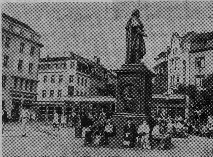
НА СНИМКЕ: памятник Людвигу ван Бетховену в старой части города Бонна — столицы ФРГ.