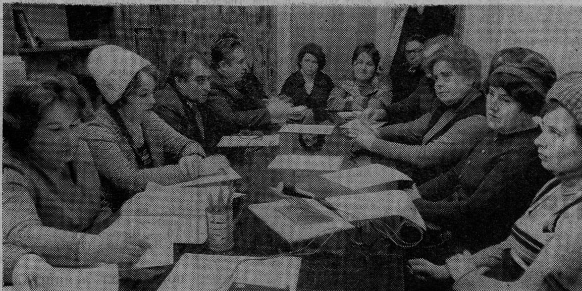
Участники встречи за «круглым столом» редакции.

В разговоре участвовали работники Сланцевского производственного объединения «Леноблводоканал», строительного треста № 63, СПМК-251, ОКСа ЛПО «Ленинградсланец», пассажирского автопредприятия, Кохтляревского участка СМУ треста «Союзшахтоосушение», коммунальные работники жэков ЛПО «Ленинградсланец», домоуправления завода «Сланцы».