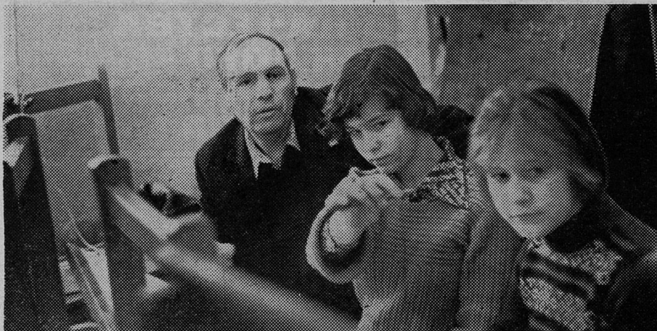
1979 ГОД — МЕЖДУНАРОДНЫЙ ГОД РЕБЕНКА