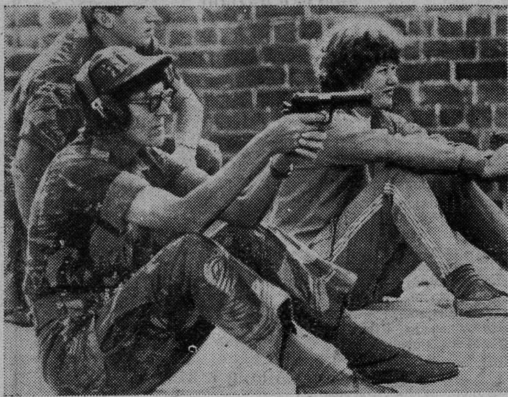
В страхе перед растущими успехами бойцов патриотических сил Зимбабве расистский режим Родезии, пытаясь продлить свое существование, прибегает к массовой мобилизации белого населения, включая женщин в возрасте от 17 до 50 лет. НА СНИМКЕ: учебные стрельбы в одном из женских подразделений родезийской армии.