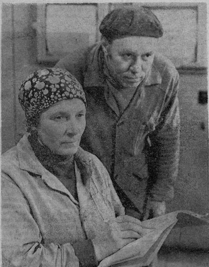
Коллектив установки обогащения сланца завода «Сланцы» признан победителем социалистического соревнования среди коллективов основных цехов за 1980 год.

Чтобы выполнить все намеченное, коллективу строительного треста № 63 немало предстоит потрудиться, а в чем-то, как говорится, начинать с начала, то есть с самого элементарного и необходимого — укрепления трудовой и исполнительской дисциплины, совершенствования организации труда на всех уровнях и, конечно, умелого использования главного резерва труда, творческих поисков общественной активности трудящихся — социалистического соревнования.