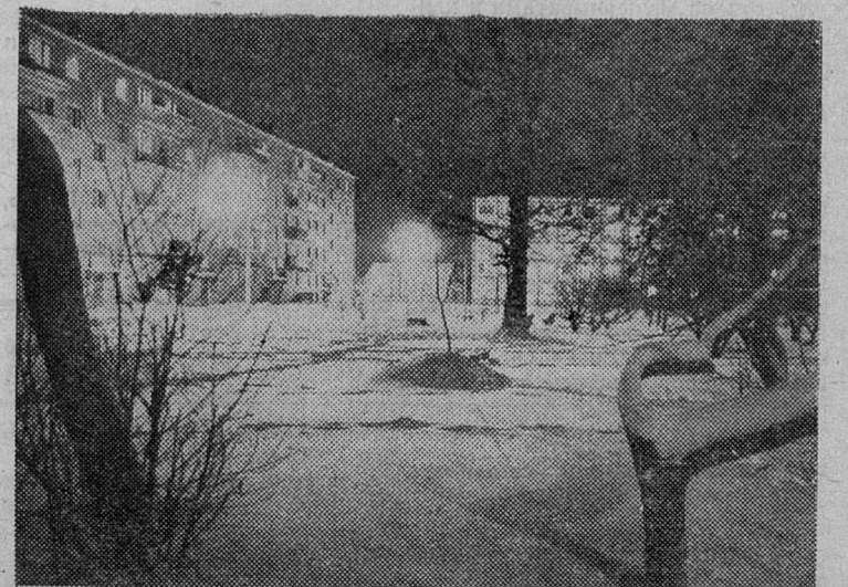
Вечерняя тишина.

Вот что сообщил главный врач центральной районной больницы В. П. ФИЯСЬ: «Кабинет доврачебного осмотра работает в поликлинике ЦРБ. Еще на один кабинет просто нет штатов».