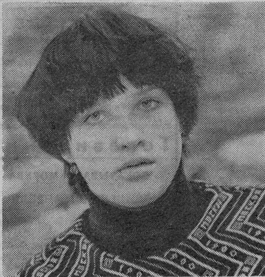
Сланцевский филиал швейного объединения «Маяк» — современное, оснащенное по последнему слову техники швейное предприятие. Коллектив в год выпускает около 150 тысяч швейных изделий.