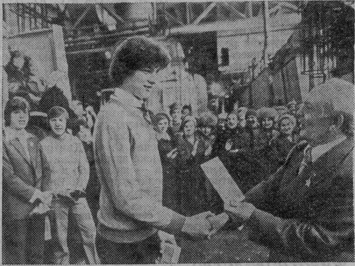
СЛУЖУ СОВЕТСКОМУ СОЮЗУ

«Быть достойными воинов-героев и ветеранов труда» — под таким девизом служат в армии посланцы прославленного коллектива тракторостроителей — Ленинградского производственного объединения «Кировский завод», потомки легендарных путиловцев.