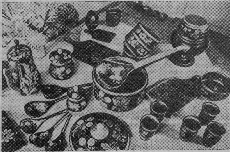
сбережение, регулярное восстановление и преумножение лесных богатств в интересах настоящего и будущего поколений советских людей — важнейшая