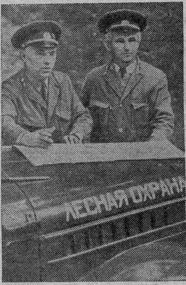
Наши леса — великое национальное богатство. Четвертая часть лесов планеты приходится на долю Советского Союза. Рациональное использование,