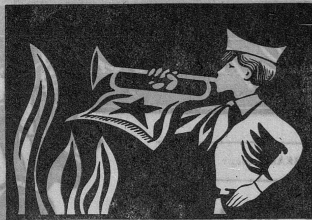
ТВОИ ВОЖАТЫЕ, ПИОНЕРИЯ!