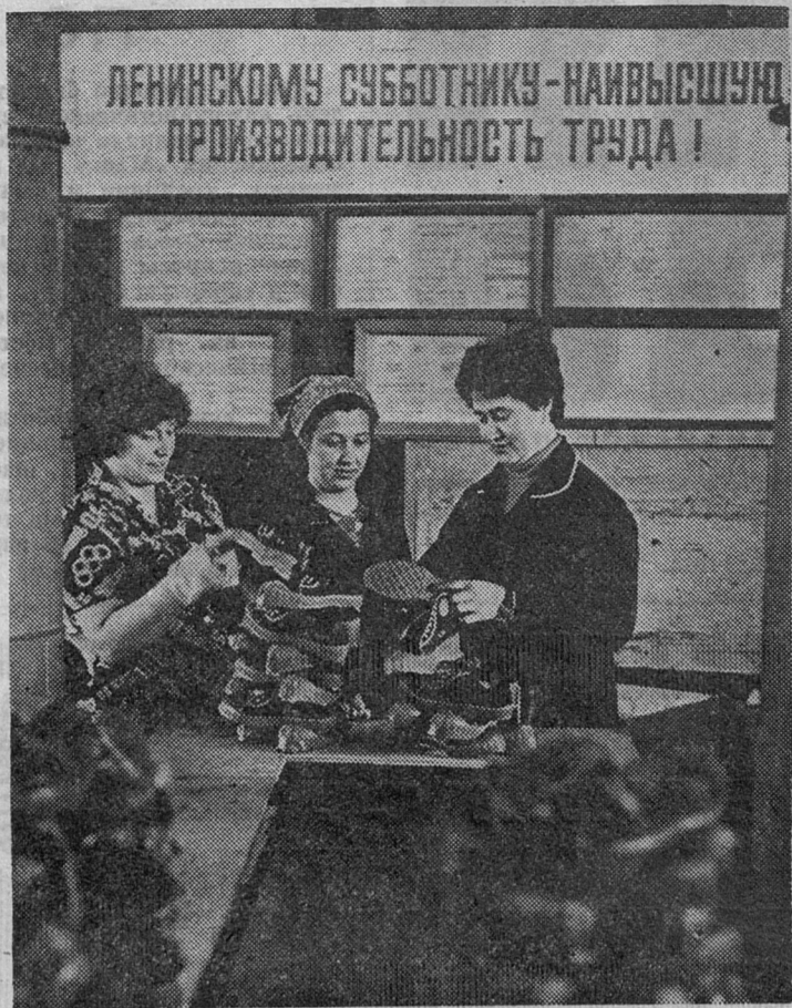
ПАРТИЙНАЯ РАБОТА: ФОРМЫ, МЕТОДЫ, РЕЗУЛЬТАТ