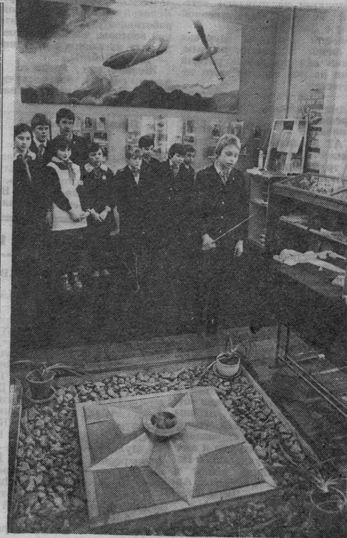
Найти следы неизвестных, воскресить память о погибших героях и воспитывать на этом поиске все новые и новые поколения школьников — таковы задачи музея Боевой славы школы № 7.