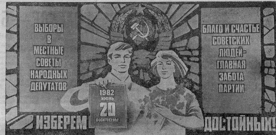
Плакат художника В. Сачкова. Издательство «Плакат».

Опыт работы, накопленный депутатами нынешнего созыва во всех сферах деятельности, немалый. Важно сделать так, чтобы люди,