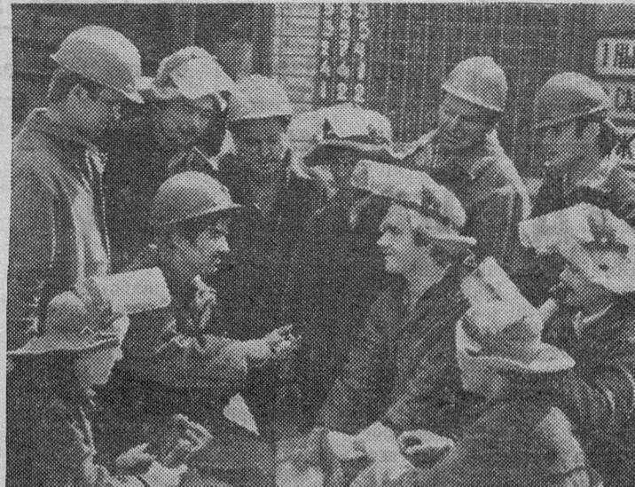
Интенсивное развитие в Казахстане получила цветная металлургия.

Преобразующая сила развитого социализма нашла яркое выражение в невиданном подъеме науки, народного образования, здравоохранения, культуры, всей духовной жизни народа. В крае, где до Великого Октября грамотность населения составляла лишь два процента, теперь действуют Академия наук, Восточное отделение ВАСХНИЛ, десятки научно-исследовательских учреждений.