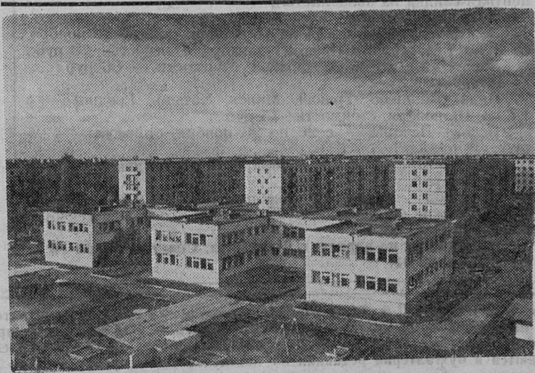
В новом микрорайоне.